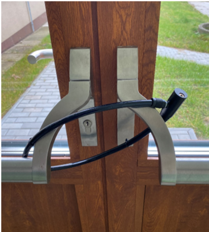
Obrázek 13: Uzavření únikových dveří školou jako řešení bezpečnosti.

význam a do jejího nákupu nebudou investovat. Norma je bezplatně přístupná na webových stránkách Ministerstva vnitra ( www.mvcr.cz ). Stačí zadat její název do vyhledávače (ČSN 73 4400).