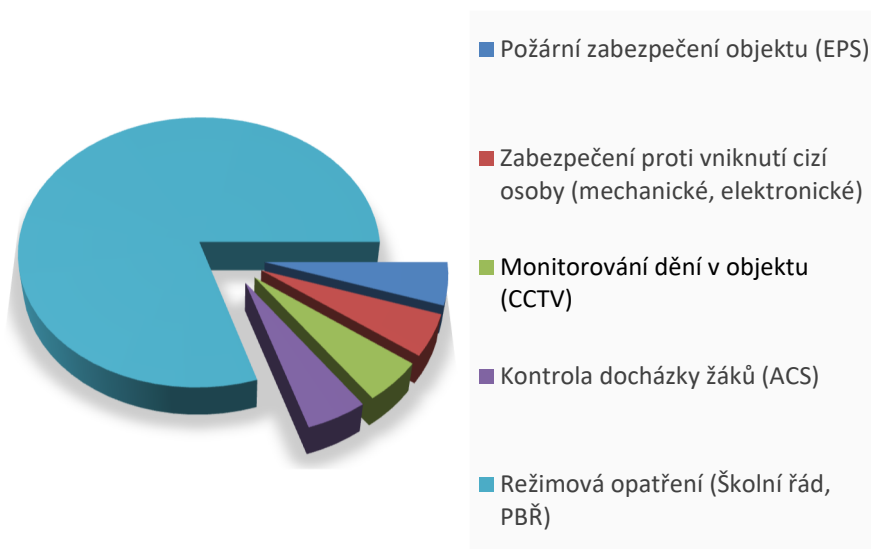
Obrázek 12: Vliv bezpečnostních opatření v závislosti na lidském faktoru.